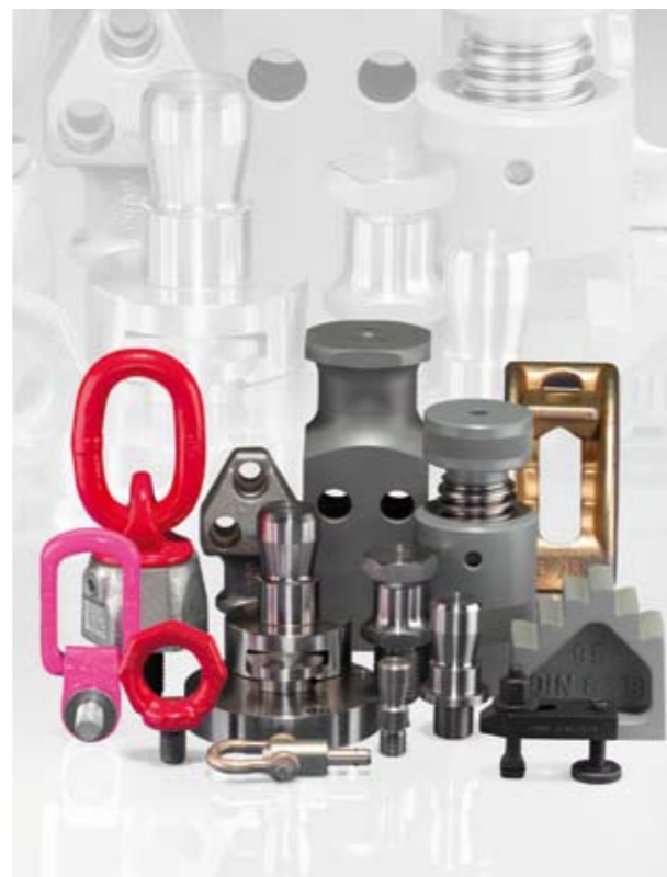
Nez, tourillons et crochets de levage, anneaux de levage, goupilles de manutention à billes, supports annulaires, broches et chapes de manutention, bride et bride à hauteur réglable, supports ajustables, cale à gradins, vis de réglage, coffrets-assortiment d'éléments de bridage.