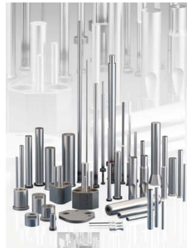
Poinçons et matrices pour l'industrie automobile ▲