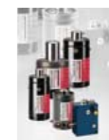
▲▲▲ Ressorts à gaz Power Line ▲▲ Ressorts à gaz ▲ Ressorts à gaz LCF ▲ Ressorts à gaz temporisés