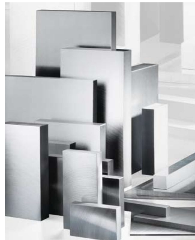
Plaques en acier et aluminium, acier plats et carrés, acier d'outillage, lames calibrées de précision et feuilles calibrées de précision.