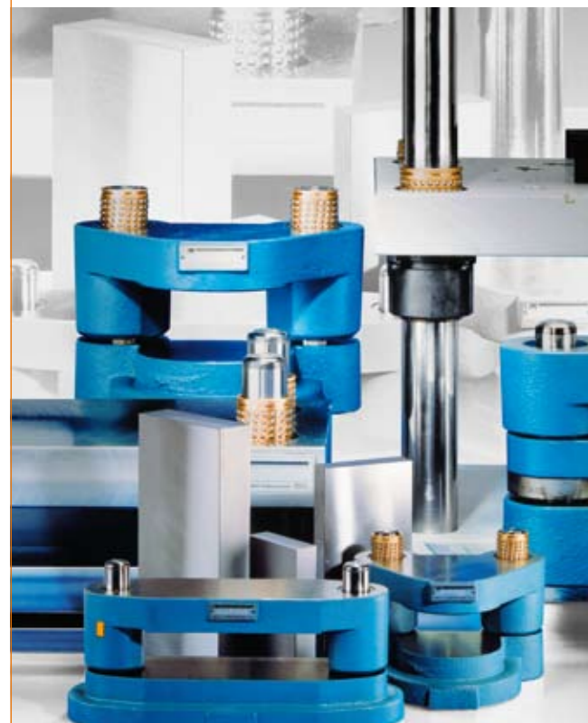
Blocs à colonnes en fonte, aluminium ou en acier.