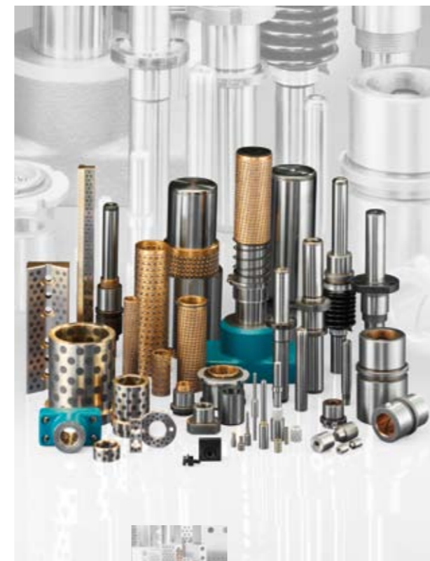
Éléments de frottement à entretien réduit ▲