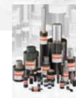
Ressorts pour les outillages de découpe-emboutissage et machines spéciales; ressorts hélicoïdaux spéciaux selon DIN ISO 10243; rondelles-ressorts; ressort élastomères; ressorts à gaz. Tous les ressorts à gaz FIBRO sont conformes à la Directive Européenne 97/23/CE.