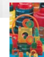
FIBROFLEX® ▲ Pièces spéciales